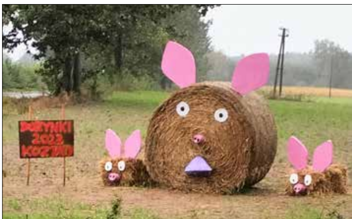
Witacz Sołectwo Kozjaty