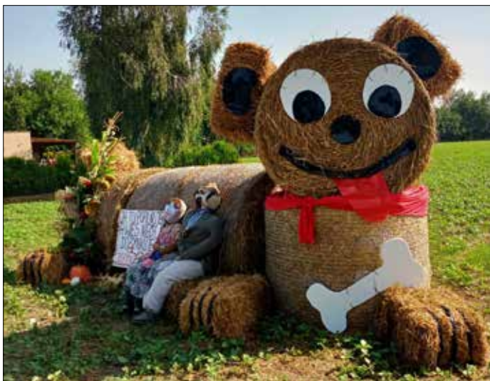
Witacz Sołectwo Borek, Znaniewo