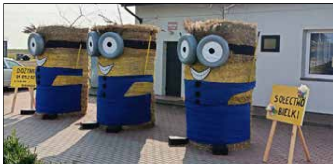
Witacz Sołectwo Bielki