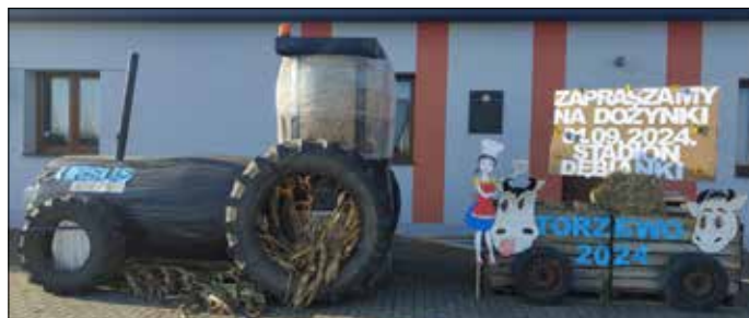
Witacz Sołectwo Torzewo