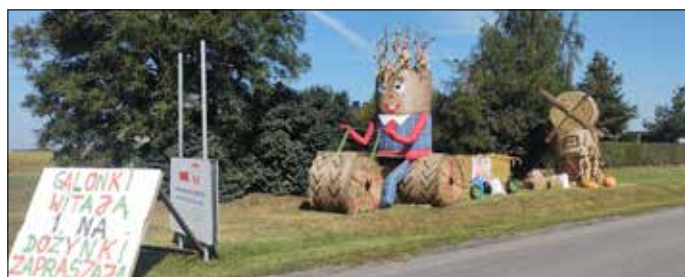
Witacz Sołectwo Galonki