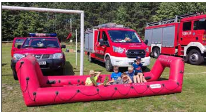
Atrakcje dla dzieci

Słowa uznania należą się także Ochotniczej Straży Pożarnej z Gminy Topólka, NSZZ Policjantów, Związkowi Zawodowemu Florian oraz Związkowi OSP RP Powiatu Radziejowskiego. Ich obecność i wsparcie były nieocenione. Dzięki nim dzieci miały okazję z bliska zobaczyć sprzęt ratowniczy i policyjny oraz dowiedzieć się więcej o pracy służb mundurowych. NSZZ Policjantów zasponsorował również wodę i lody dla dzieci, co dodatkowo umiliło ten piękny dzień.