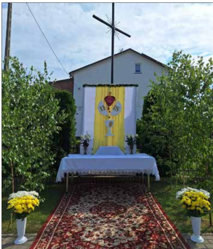
Ołtarz w parafii Mąkoszyn