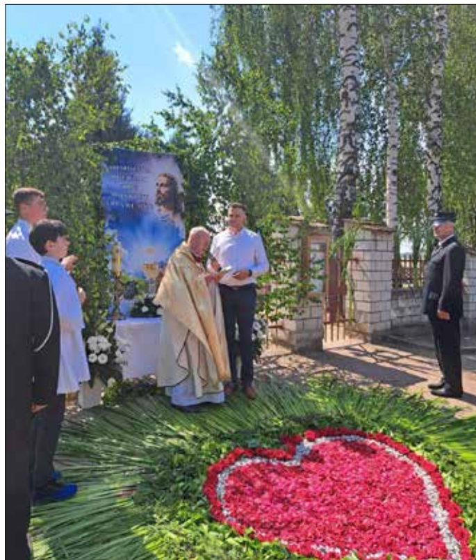
Ołtarz w parafii Orle