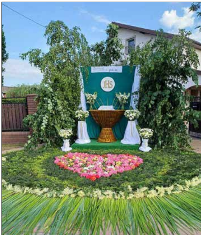
Ołtarz w parafii Topólka