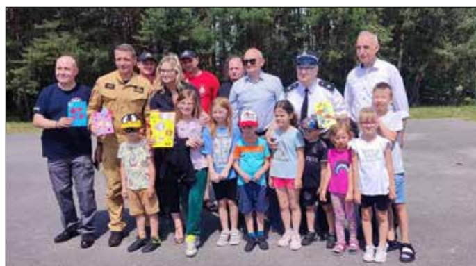
Organizatorzy wraz z uczestnikami

Ten wyjątkowy dzień nie mógłby się odbyć bez wspólnego zaangażowania wielu osób i instytucji. Dziękujemy wszystkim, którzy przyczynili się do sukcesu tego wydarzenia, sprawiając, że dzieci mogły cieszyć się niezapomnianymi chwilami pełnymi zabawą, radością i uśmiechem.