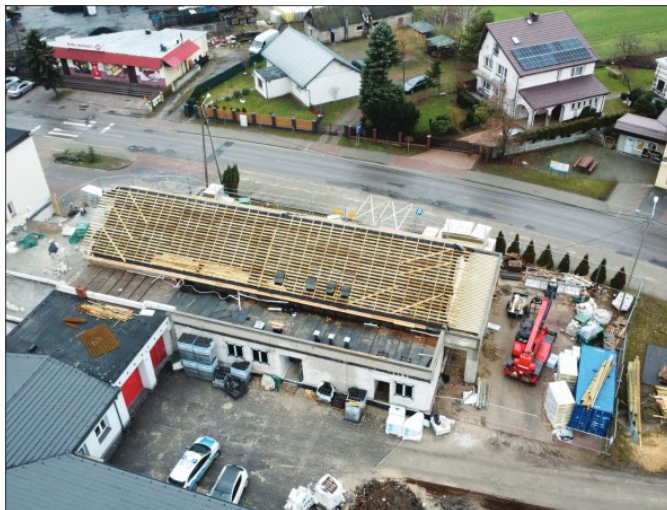
Budowa łącznika między Gminnym Ośrodkiem Kultury, a Urzędem Gminy w Topólce wraz z modernizacją Gminnego Ośrodka Kultury oraz utwardzeniem placu