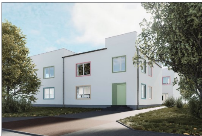
Proponowana wizualizacja przedszkola