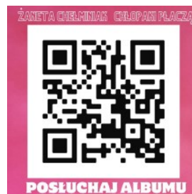
Tekst: Anna Migdalska

Czekamy z niecierpliwością na kolejne rozdziały tej muzycznej podróży. Prezentujemy okładkę i kod QR, który wystarczy zeskanować, by posłuchać płyty w ulubionym serwisie streamingowym: