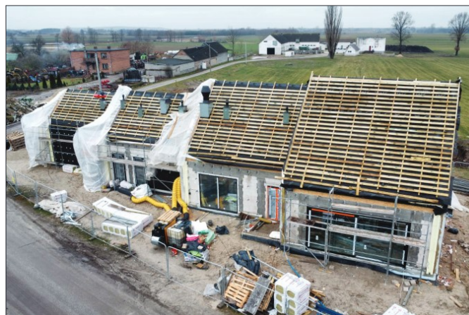
Budowa remizy OSP w miejscowości Kozjaty